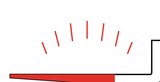
Polies avec dessous profilé en deux sections

Veuillez envoyer ce formulaire dûment rempli par courriel à fourches@vallee.ca . Pour toute question, veuillez communiquer avec nous au 418 268-8955, poste 114.