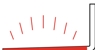
Polies avec dessus entièrement profilé