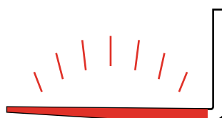
Polies avec dessous entièrement profilé